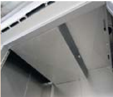
Einfach demontierbare Nutzraumdecke

caldatrac® - damit es richtig gut läuft.