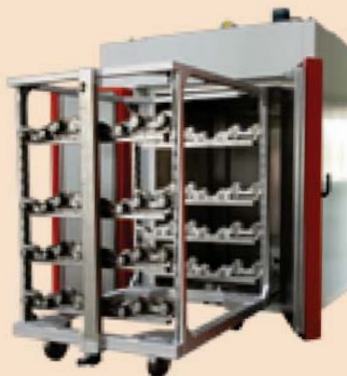
Industrieofen mit Rotationsbeschickungswagen