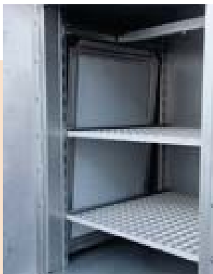
Temperofen mit HEPA-Reinraumfilterwand