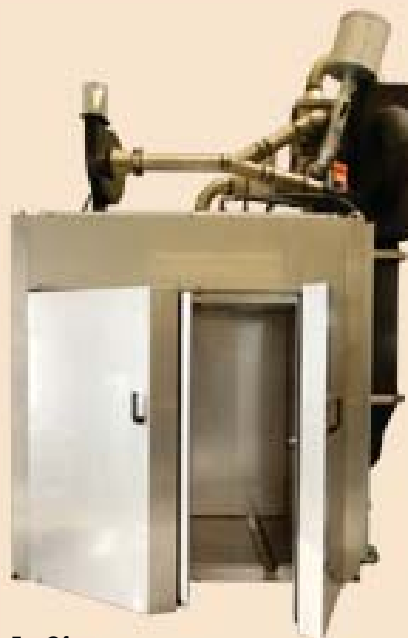
Ex-Ofen mit Kältekühlfalle