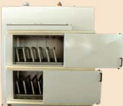
Vorwärmofen für Modellformplatten