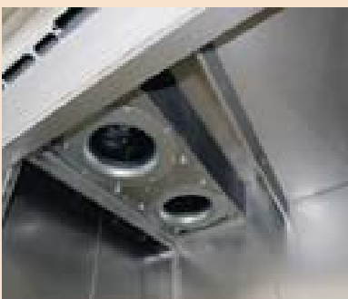
Offene Nutzraumdecke mit Blick auf die Umluftventilatorräder