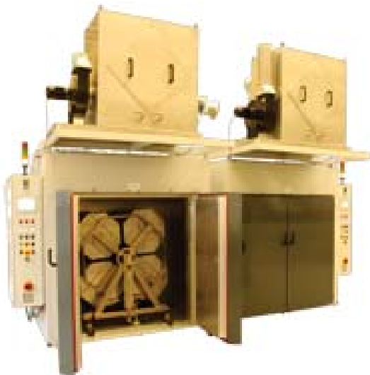
Silikonofen mit Rotationstrommelwagen