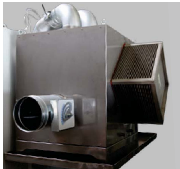
Edelstahl-Kreuzstromwärmetauscher mit vollautomatischer Frischluft-Volumenstromregelung Typ A