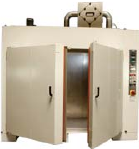
CDF 200/100/150-25 mit Kreuzstromwärmetauscher