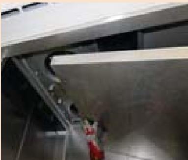
Demontage ohne Werkzeug möglich