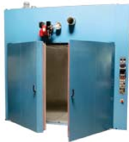
CDF 260/200/200-22 indirekt gasbeheizter Industrieofen