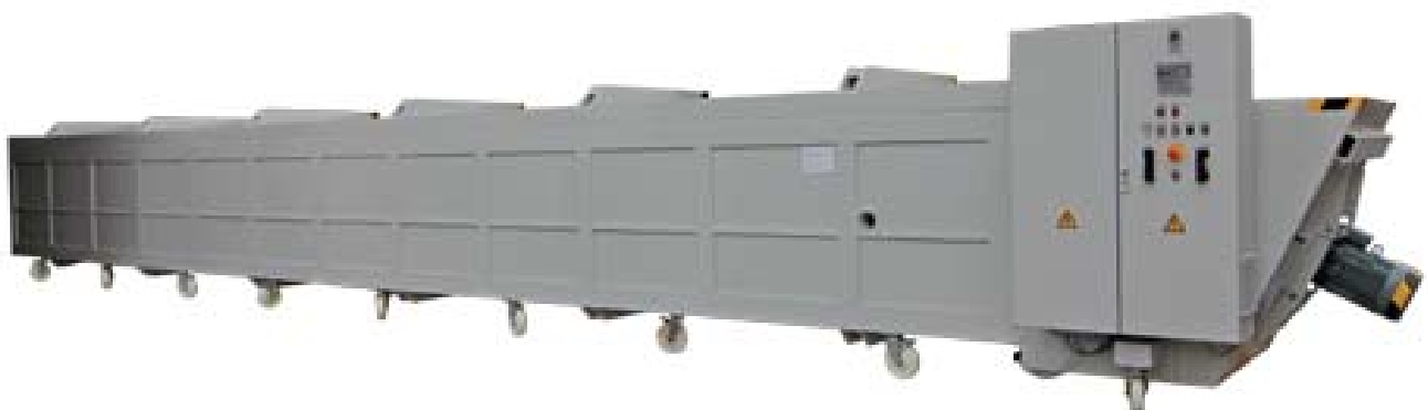
Truhenofen mit metallfreiem Nutzraum (12 m Länge)