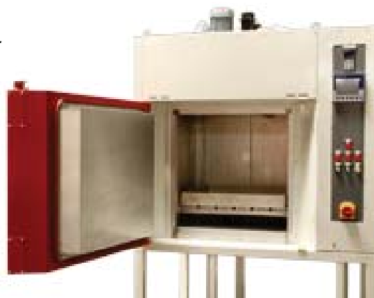
CD 60/60/60-18 Öl-Temperierschrank