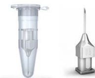
Ansaugnadel in verschließbarer Schutzpatrone