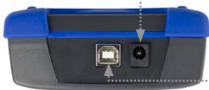
Handgerät Oberseite: USB-Port + Netzgerät

Das AtmoCheck® ONE Ladegerät für den integrierten Akku. Mit Power-Plug-Adaptoren für In- und Ausland.