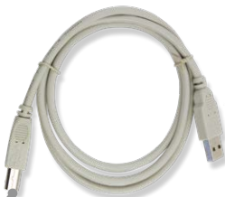
Datenkabel USB 2.0 Länge ca. 1 Meter